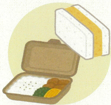
銘柄畜産物を使った お弁当、サンドイッチ