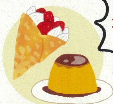
銘柄卵を使ったスイーツ